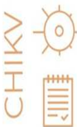
Tab. 4 — Distribuzione casi confermati febbre Chikungunya per provincia di domicilio

Tempi di segnalazione: entro le 12 ore dal sospetto diagnostico al Servizio di Igiene e Sanità Pubblica dei Dipartimenti di Prevenzione dell'AULSS competente per territorio -> immediatamente alla Regione